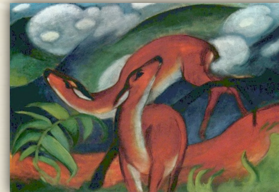
Franz Marc - I caprioli rossi (1912)